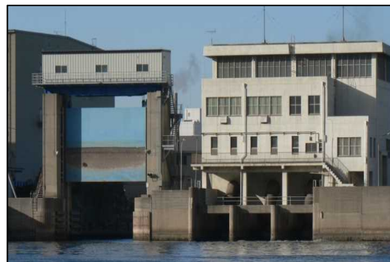
S47年に建設された栄水門、栄排水機場

高潮浸水想定区域内には駅・市役所・消防署・電力会社・NTT・緊急輸送道路などの重要な施設が密集！！