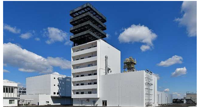
消防学校・防災研修センター 屋内訓練場・総合訓練棟