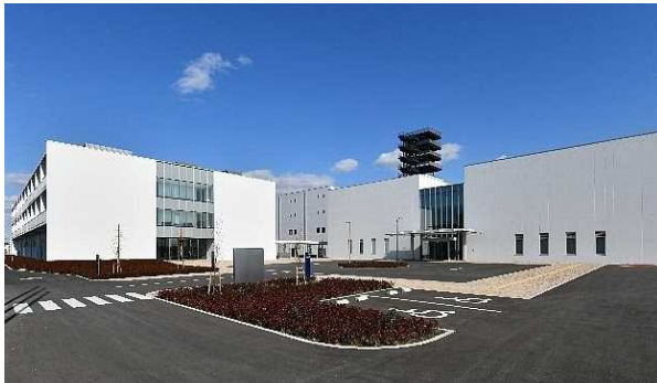
消防学校・防災研修センター 宿泊棟・教育棟

平成 3 0 年度には、千葉県消防学校・防災研修センター、千葉県立市川特別支援学校作業棟等が完成しました。