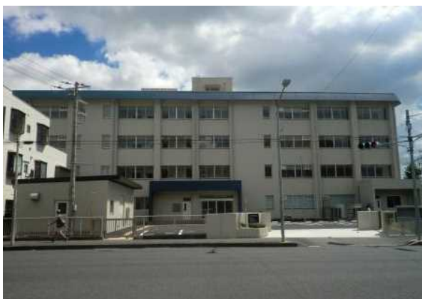
旧ちばキャリアアップセンターの大規模 改修工事（現在の都町合同庁舎）

平成 3 0 年度は、旧ちばキャリアアップセンターの大規模改修工事（改修後は都町合同庁舎として供用を開始）、幕張メッセ施設整備工事（トイレリニューアル）などを実施しました。