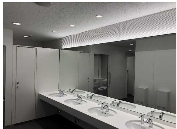
幕張メッセ施設整備工事 （トイレリニューアル）