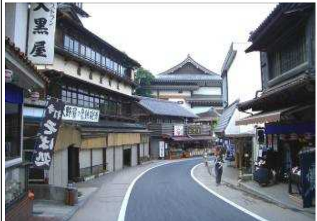
門前町の町並み（成田市）

NPO法人 久留里フィールドミュージアム（君津市） 柏の葉アーバンデザインセンター（柏市） 幕張新都心まちづくり協議会（千葉市） 仲町街づくり協議会（成田市） 上町街づくり協議会（成田市） 花一参道街づくり協議会（成田市） 花崎町街づくり研究会（成田市） NPO法人 KAO（カオ）の会（鎌ヶ谷市） 我孫子の景観を育てる会（我孫子市） 海・まち・デザイン（浦安市） 行徳グリーン・クリンの会（市川市） 下田の杜里山協議会（柏市） うらやす景観まちづくりフォーラム（浦安市）