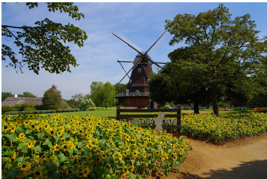
アンデルセン公園(船橋市)

都市緑地法に基づき、民間の建築物の屋上、空地など敷地内を緑化する計画について市町村長の認定を受けることができる制度です。