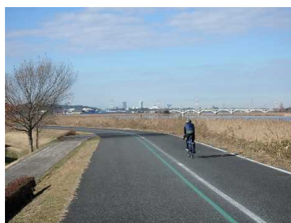
手賀沼自然ふれあい緑道