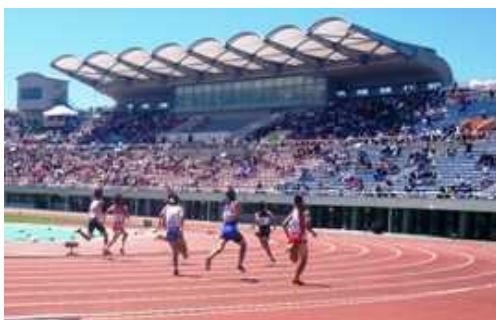
千葉県総合スポーツセンター

文化とコミュニティをテーマとし、自然の地形を生かすとともに、樹林地を極力残した北総地域の中核的な都市公園として、平成6年度から旧住宅・都市整備公団（現・独立行政法人都市再生機構）が整備を進め、県が引き継ぎました。平成12年度から供用を開始し、現在は、36.1haを供用しています。