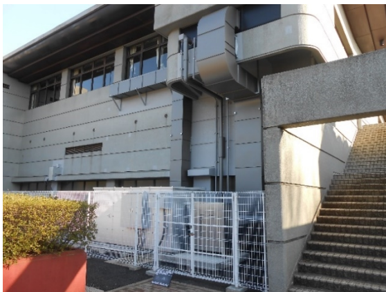
千葉県総合スポーツセンター武道館 空調設備改修工事（1 期）

平成 28 年度は、千葉県総合スポーツセンター武道館空調設備改修工事（1 期）、千葉縣市原健康福祉センター耐震改修外建築工事などを実施しました。