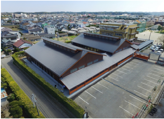
安房高等学校 柔剣道場

平成 28 年度には、県立安房高等学校柔剣道場、富津公園大池トイレ等が完成しました。