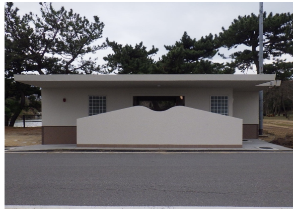
富津公園 大池トイレ