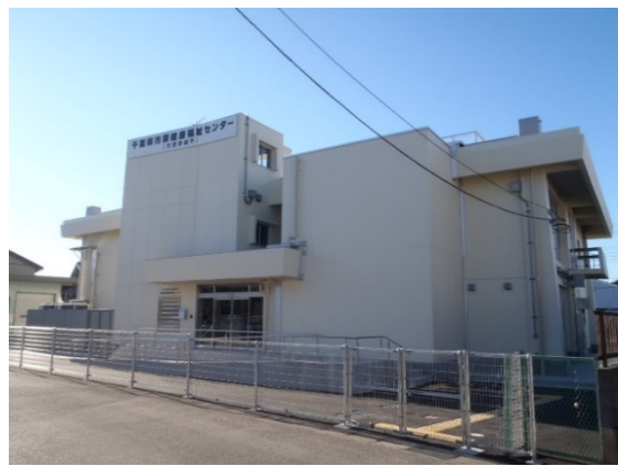
千葉縣市原健康福祉センター 耐震改修外建築工事