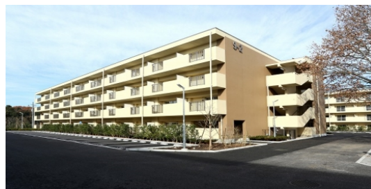
千城台西県営住宅（千葉市）

これらの管理業務は、入居者の募集・決定、住宅の修繕、家賃の収納など広範囲にわたっていることから、住宅管理の一層の効率化と入居者へのサービス向上を図るため、平成18年4月に公営住宅法に基づく管理代行制度を導入し、千葉県住宅供給公社に県営住宅の管理業務の一部を代行させています。