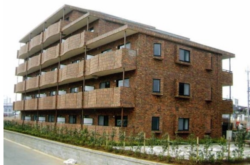
特定優良賃貸住宅（ノーブル東松戸：松戸市）

特定優良賃貸住宅（略称：特優賃）とは、法律に基づいて、中堅所得者向けに供給されるファミリータイプの賃貸住宅で、土地所有者（オーナー）が建設し、県（政令市）の指定を受けた法人が管理を行う制度です。また、国と県（政令市）からの補助により入居者の負担が軽減されます。平成15年度末までに、県全体で6,973戸（県5,735戸、千葉市1,238戸）建設され、平成29年3月末現在、県全体で2,388戸（県2,018戸、千葉市370戸）が供給されています。