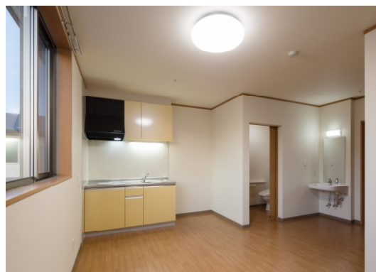
サービス付き高齢者向け住宅（ういず・ユー ホープリビング成田）