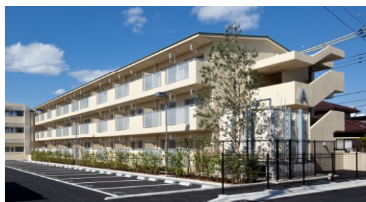
成田市南囲護台団地（成田市）