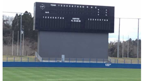
長生の森公園野球場スコアボード改修工事