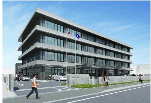
山武合同庁舎 外観完成イメージ