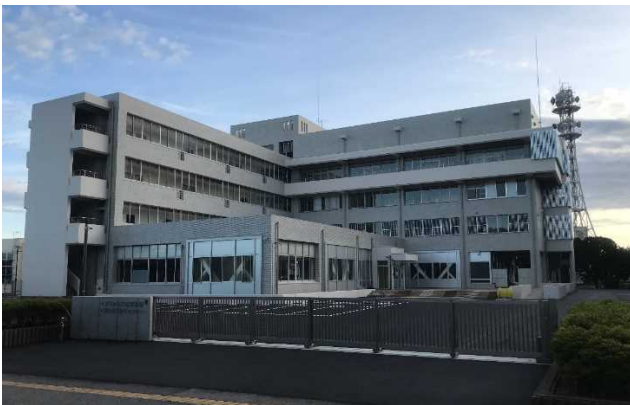
千葉県中央児童相談所・警察少年センター （旧青少年女性会館）の耐震・大規模改修工事

令和2年度は、千葉県中央児童相談所・警察少年センター（旧青少年女性会館）の耐震・大規模改修工事、長生の森公園野球場のスコアボードの改修工事などを実施しました。