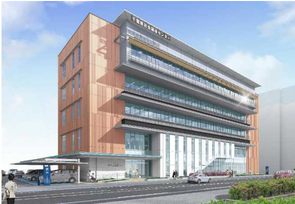
社会福祉センター 外観完成イメージ

令和2年度は、社会福祉センター建築工事や山武合同庁舎の建替工事などに着手しました。