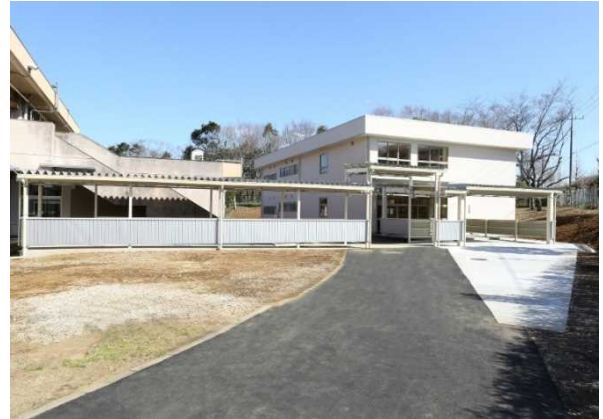
市原特別支援学校 教室棟