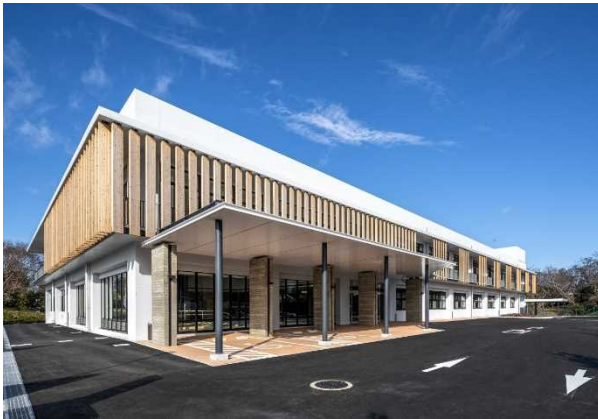
農林総合研究センター 新本館

令和元年度には、農林総合研究センター新本館の新築工事、市原特別支援学校教室棟の増築工事等が完成しました。