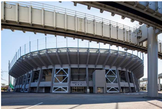
千葉県総合スポーツセンター野球場の 耐震・大規模改修工事

令和元年度は、千葉県総合スポーツセンター野球場の耐震・大規模改修工事、幕張メッセ施設整備工事（中央エントランスリニューアル）などを実施しました。