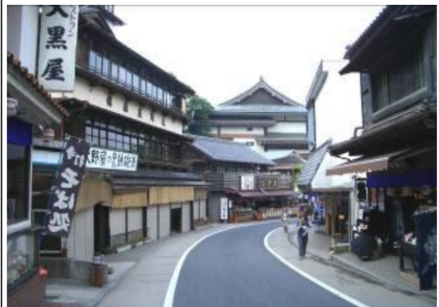
門前町の町並み（成田市）

NPO法人 久留里フィールドミュージアム（君津市） 柏の葉アーバンデザインセンター（柏市） 幕張新都心まちづくり協議会（千葉市） 仲町街づくり協議会（成田市） 上町街づくり協議会（成田市） 花一参道街づくり協議会（成田市） 花崎町街づくり研究会（成田市） NPO法人 KAO（カオ）の会（鎌ヶ谷市） 我孫子の景観を育てる会（我孫子市） 海・まち・デザイン（浦安市） 行徳グリーン・クリンの会（市川市） 下田の杜里山協議会（柏市） うらやす景観まちづくりフォーラム（浦安市）