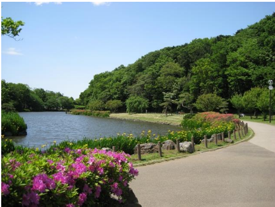
じゅん菜池緑地（市川市）

都市緑地法に基づき、民間の建築物の屋上、空地など敷地内を緑化する計画について市町村長の認定を受けることができる制度です。