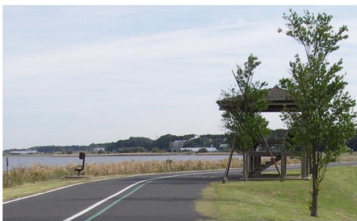
手賀沼自然ふれあい緑道