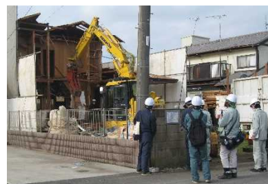
解体工事現場へのパトロール