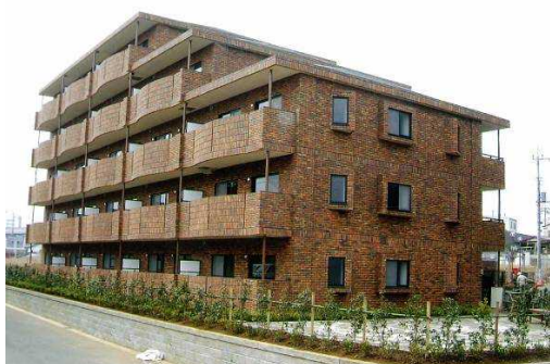
特定優良賃貸住宅（ノーブル東松戸：松戸市）

特定優良賃貸住宅（略称：特優良）とは、法律に基づいて、中堅所得者向けに供給されるファミリータイプの賃貸住宅で、土地所有者（オーナー）が建設し、県（政令市）の指定を受けた法人が管理を行う制度です。また、国と県（政令市）からの補助により入居者の負担が軽減されます。平成 15 年度末までに、県全体で 6,973 戸（県 5,735 戸、千葉市 1,238 戸）建設され、平成 26 年 3 月末現在、県全体で 5, 2 1 2 戸（県 4, 2 2 0 戸、千葉市 9 9 2 戸）が供給されています。