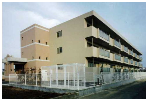
特定優良賃貸住宅（ロアジュール上山：船橋市）