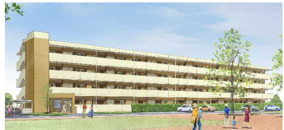
千城台西県営住宅17号棟(千葉市)完成イメージ

これらの管理業務は、入居者の募集・決定、住宅の修繕、家賃の収納など広範囲にわたっていることから、住宅管理の一層の効率化と入居者へのサービス向上を図るため、平成18年4月に公営住宅法に基づく管理代行制度を導入し、千葉県住宅供給公社に県営住宅の管理業務の一部を代行させています。