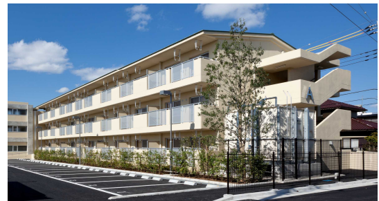
成田市南団護台団地(成田市)

昭和26年度の公営住宅法施行以降、平成25年度までに28,516戸建設され、47市町村が22,077戸を管理しています。