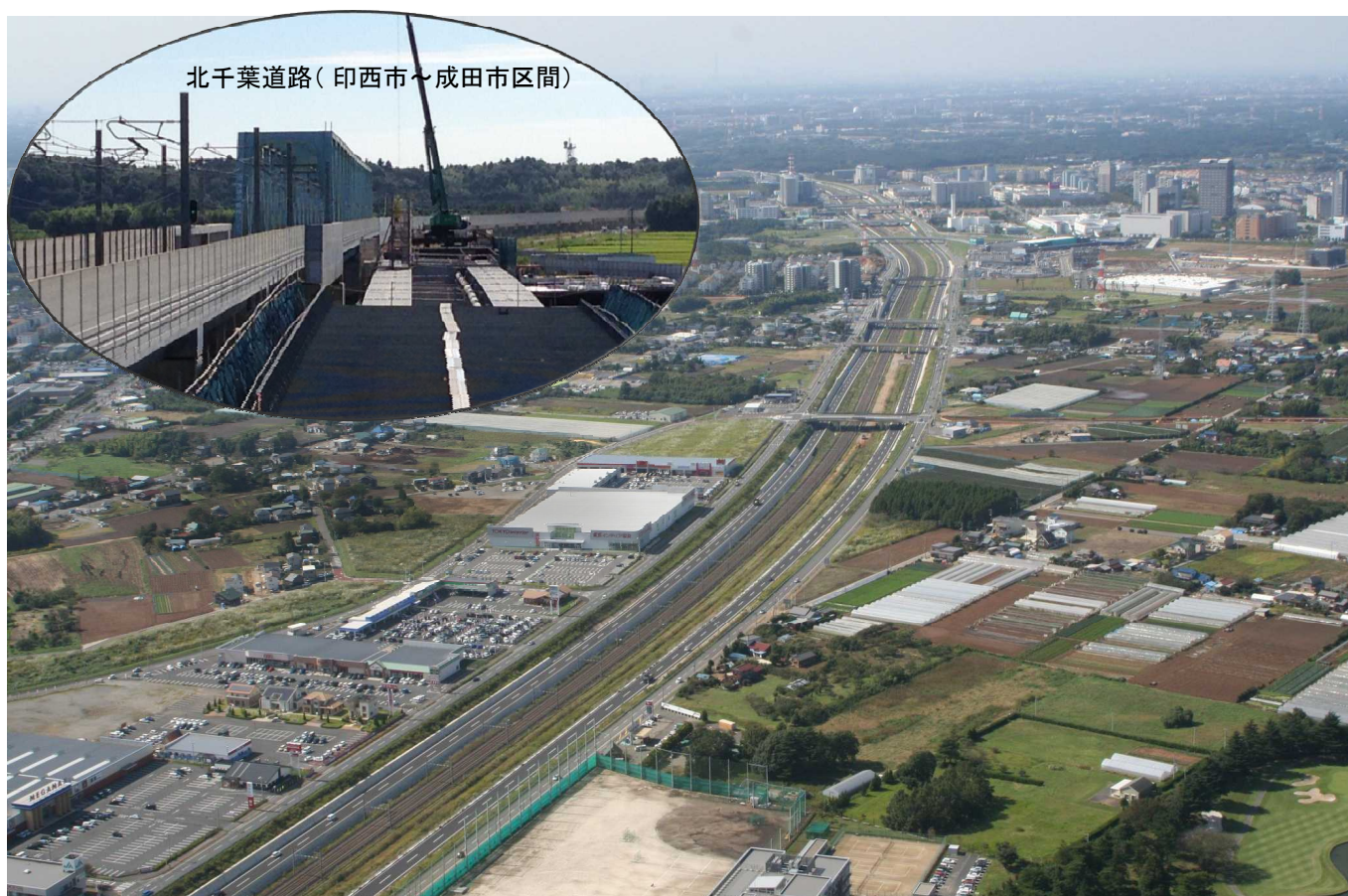
北千葉道路(印西市～成田市区間)