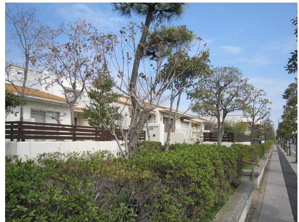
景観に配慮された住宅街（浦安市）

NPO法人 久留里フィールドミュージアム（君津市） 柏の葉アーバンデザインセンター（柏市） 幕張新都心まちづくり協議会（千葉市） 仲町街づくり協議会（成田市） 上町街づくり協議会（成田市） 花一参道街づくり協議会（成田市） 花崎町街づくり研究会（成田市） NPO法人 KAO（カオ）の会（鎌ヶ谷市） 我孫子の景観を育てる会（我孫子市） 行徳グリーン・クリンの会（市川市） NPO法人 下田の杜里山フォーラム（柏市） うらやす景観まちづくりフォーラム（浦安市）