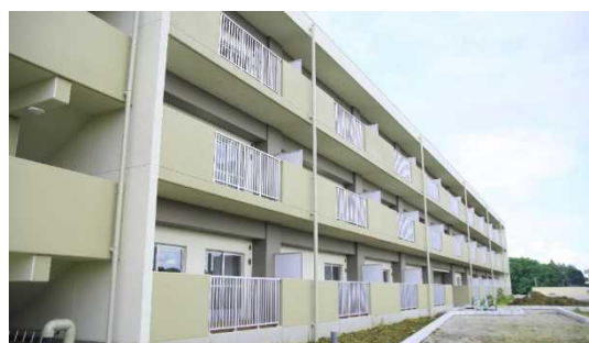
佐津間県営住宅（鎌ヶ谷市）

県営住宅の管理業務は、入居者の募集・決定、住宅の修繕、家賃の収納など広範囲にわたっていることから、住宅管理の一層の効率化と入居者へのサービス向上を図るため、平成18年4月に「公営住宅法」に基づく管理代行制度を導入し、千葉県住宅供給公社に県営住宅の管理業務の一部を代行させています。