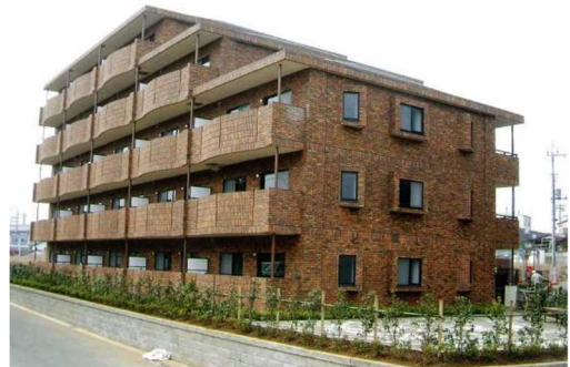
特定優良賃貸住宅（ノーブル東松戸：松戸市）

特定優良賃貸住宅（略称：特優良）とは、法律に基づいて、中堅所得者向けに供給されるファミリータイプの賃貸住宅で、土地所有者（オーナー）が建設し、県（政令市）の指定を受けた法人が管理を行う制度です。また、国と県（政令市）からの補助により入居者の負担が軽減されます。平成15年度末までに、県全体で6,973戸（県5,735戸、千葉市1,238戸）建設され、令和3年度末現在、県全体で245戸（県245戸、千葉市0戸）が供給されています。