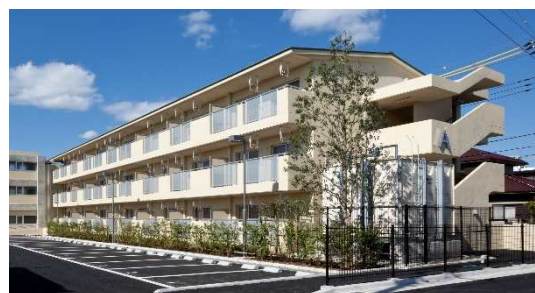
成田市南団護台団地（成田市）

昭和26年度の公営住宅法施行以降、令和3年度までに29,316戸建設（借上戸数1,484戸含む）され、47市町村が21,505戸を管理しています。