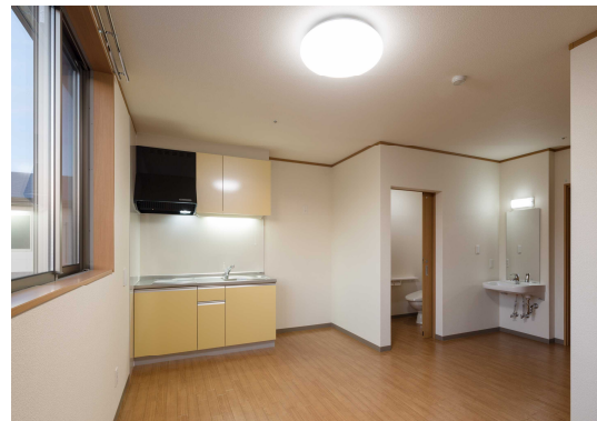
サービス付き高齢者向け住宅（ういず・ユー ホープリビング成田）