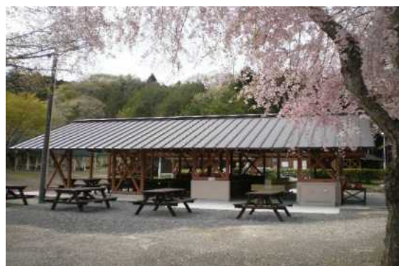
清和県民の森ロッジ村炊事棟