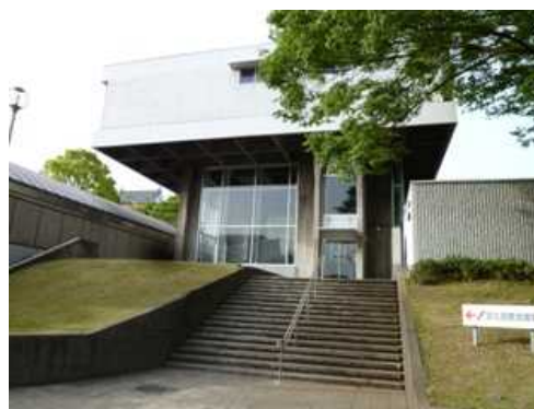
千葉県文化会館聖賢堂（耐震補強）