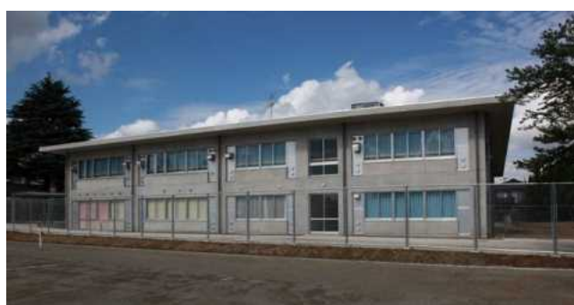
県立千葉高等学校中学生棟

平成 22 年度には、県立千葉高等学校中学生棟、清和県民の森ロッジ村炊事棟等が完成しました。