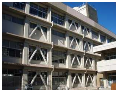
県立成東高等学校校舎（耐震補強）

平成 22 年度は、耐震改修工事として県立成東高等学校校舎、千葉県文化会館聖賢堂等を施工しました。