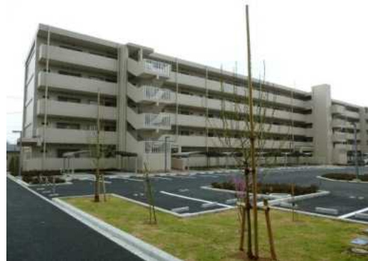
金ヶ作県営住宅（松戸市）

これらの管理業務は、入居者の募集・決定、住宅の修繕、家賃の収納など広範囲にわたっていることから、住宅管理の一層の効率化と入居者へのサービス向上を図るため、平成18年4月に公営住宅法に基づく管理代行制度を導入し、千葉県住宅供給公社に県営住宅の管理業務の一部を代行させています。