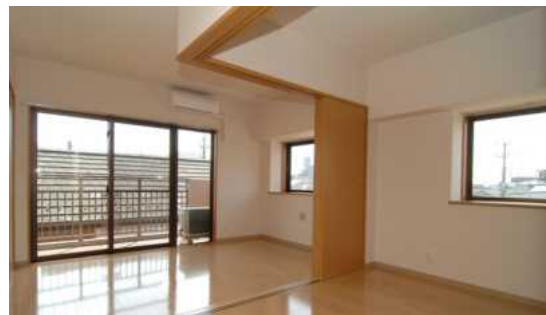
高齢者向け優良賃貸住宅（サウスコート・スカイ：市川市による事業）