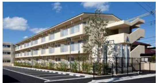
成田市南岡護台団地（成田市）

昭和26年度の公営住宅法施行以降、平成21年度までに28,395戸建設され、47市町村が22,408戸を管理しています。平成22年度には、成田市及び勝浦市において22戸が建設されました。