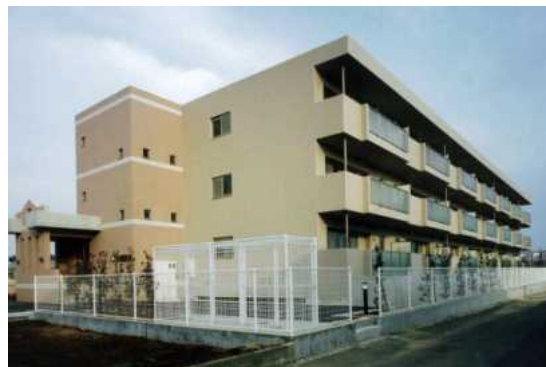
特定優良賃貸住宅（ロアジール上山：船橋市）