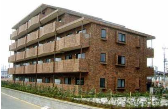
特定優良賃貸住宅（ノーブル東松戸：松戸市）

特定優良賃貸住宅（略称：特優賃）とは、法律に基づいて、中堅所得者向けに供給されるファミリータイプの賃貸住宅で、土地所有者（オーナー）が建設し、県（政令市）の指定を受けた法人が管理を行う制度です。また、国と県（政令市）からの補助により入居者の負担が軽減されます。平成15年度末までに、県全体で6,973戸（県5,735戸、千葉市1,238戸）建設され、平成23年3月末現在、県全体で6,245戸（県5,142戸、千葉市1,103戸）が供給されています。