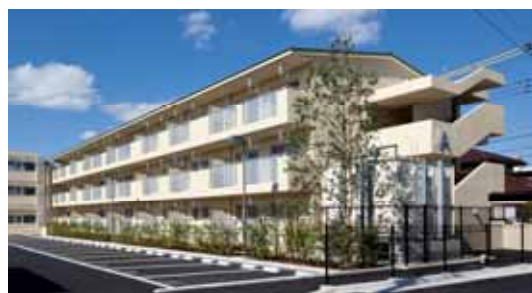
成田市南岡護台団地（成田市）

昭和 26 年度の公営住宅法施行以降、平成 21 年度までに 28,373 戸建設され、47 市町村が 22,390 戸を管理しています。平成 21 年度には、成田市及び勝浦市において 22 戸が建設されました。