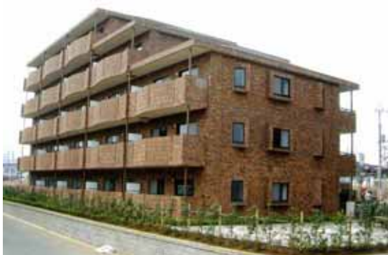
特定優良賃貸住宅（ノーブル東松戸：松戸市）

特定優良賃貸住宅（略称：特優賃）とは、法律に基づいて、中堅所得者向けに供給されるファミリータイプの賃貸住宅で、土地所有者（オーナー）が建設し、県（政令市）の指定を受けた法人が管理を行う制度です。また、国と県（政令市）からの補助により入居者の負担が軽減されます。平成15年度末までに、県全体で6,973戸（県5,735戸、千葉市1,238戸）建設され、平成22年3月末現在、県全体で6,491戸（県5,364戸、千葉市1,127戸）が供給されています。