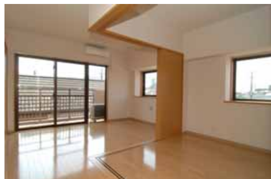
高齢者向け優良賃貸住宅（サウスコート・スカイ：市川市による事業）