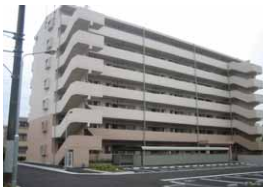
海神県営住宅（船橋市）

県営住宅では、入居者の募集・決定、住宅の修繕、家賃の収納などの一層の効率化と入居者へのサービス向上を図るため、平成 18 年 4 月に公営住宅法に基づく管理代行制度を導入し、千葉県住宅供給公社に管理を代行させています。