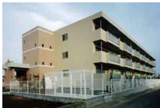
特定優良賃貸住宅（ロアジュール上山：船橋市）