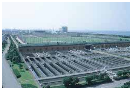
花見川終末処理場

また、花見川第二終末処理場は、約283千 m^3 /日の処理能力を有する水処理施設が稼働しています。