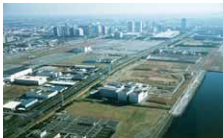
花見川第二終末処理場