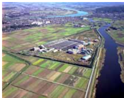
手賀沼終末処理場

平成22年3月末においては、314千 m^3 /日の処理能力を有する水処理施設が稼働しています。