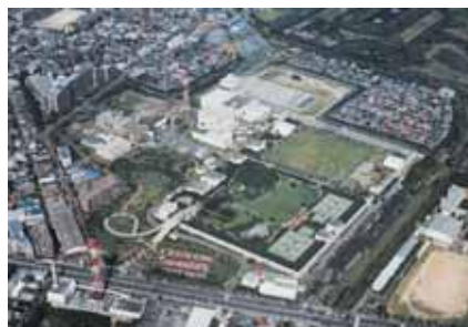
江戸川第二終末処理場

平成22年3月末においては、464千 m^3 /日の処理能力を有する水処理施設が稼働しています。