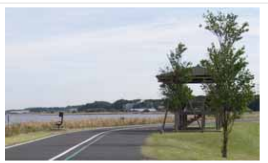
手賀沼自然ふれあい緑道