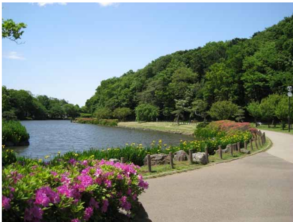
じゅん菜池緑地(市川市)

また、このほか16市で各市の条例により、保存樹2,843本、保存樹林1,583箇所6,274,211㎡が指定されています。