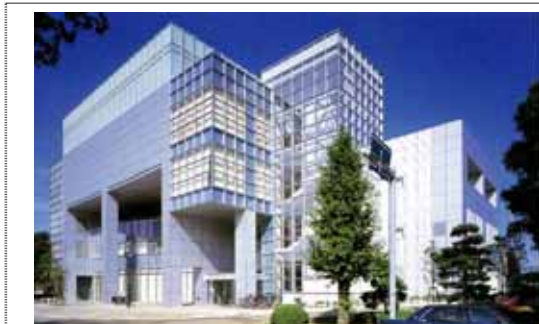
千葉県スポーツセンター

文化とコミュニティをテーマとし、自然の地形を生かすとともに、樹林地を極力残した北総地域の中核的な都市公園として、平成6年度から旧住宅・都市整備公団（現・独立行政法人都市再生機構）が整備を進め、県が引き継ぎました。平成12年度から供用を開始し、現在は、36.1ヘクタールを供用しています。