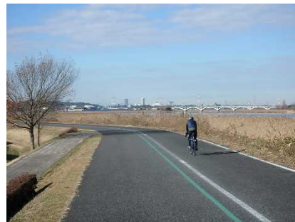
手賀沼自然ふれあい緑道