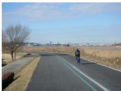
手賀沼自然ふれあい緑道

令和6年4月1日現在、3.7haを供用しており、その他の施設についても整備を進めています。