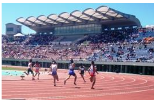
千葉県総合スポーツセンター

文化とコミュニティをテーマとし、自然の地形を生かすとともに、樹林地を極力残した北総地域の中核的な都市公園として、平成6年度から旧住宅・都市整備公団（現・独立行政法人都市再生機構）が整備を進め、県が引き継ぎました。平成12年度から供用を開始し、現在は、36.1haを供用しています。