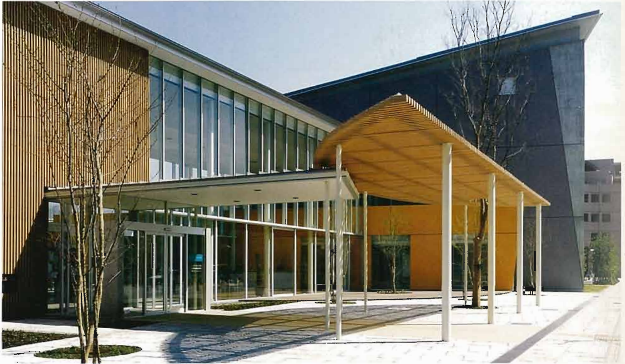
プロムナード側全景、エントランスと音楽ホール

幕張ベイタウンは、わが国でヨーロッパ的な街路型のまちづくりをめざした数少ない事例の一つである。元来そこにあった都市の文脈や構造をベースに重層させていくそのオリジナルのありようとは異なり、幕張では全く新しい白紙の上にそのような都市空間を、しかも短時間のうちに構築することが前提であった。明快な図と地の関係によって構成されるこの街路型のまちづくりは、それゆえに大きな関心を集め、これまでさまざまな議論が展開されてきた。