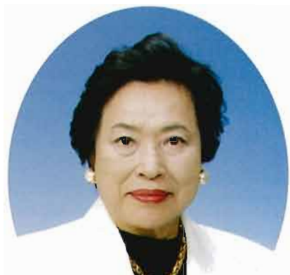
千葉県知事 堂本 暁子

平成14年度の千葉県建築文化賞に多くの皆様から御応募をいただき、誠にありがとうございました。