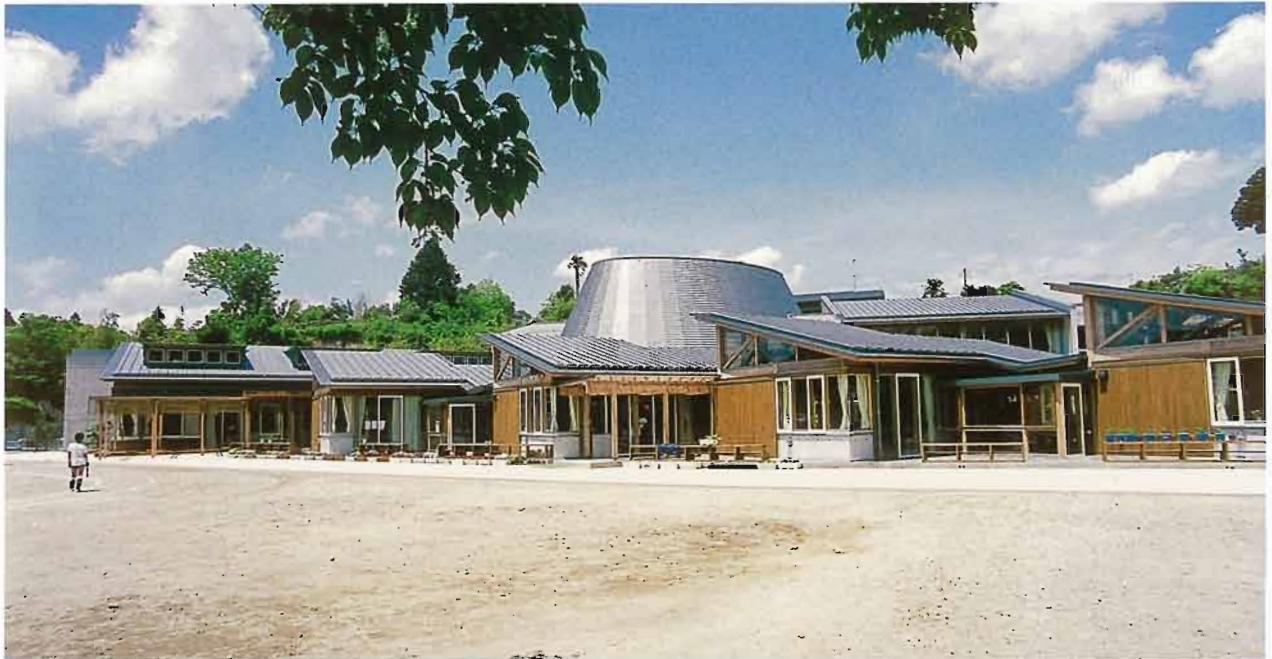
多目的ホールとクラスター棟

養老溪谷の豊かな自然に恵まれた地域に建設された大多喜町立老川小学校は、分校の統合を行っても現在の児童数が72名という小さな小学校であるが、公民館のような地域の拠点としても位置付けられた建物である。