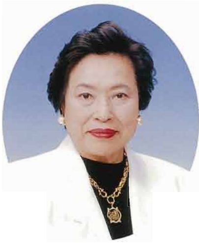
千葉県知事 堂本 暁子

平成13年度の千葉県建築文化賞に多くの皆様から御応募をいただき、誠にありがとうございました。