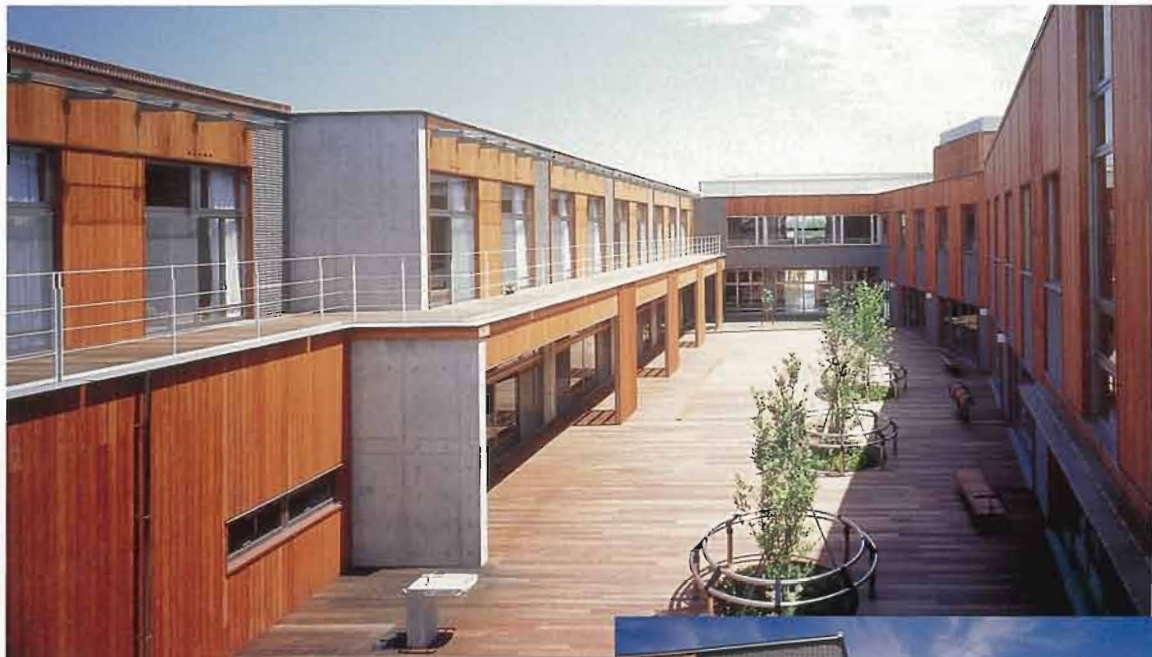
木質で仕上げた安らぎの広場

ディアフレンズ美浜は、稲毛海浜公園や住宅団地、学校などにほど近い街なか平成13年4月に開設された福祉施設である。障害のある子供の将来を案じてその進路の開拓に向け様々な活動を続けている「千葉市肢体不自由児者父母の会」が設立母体となった。「親亡き後も安心して障害者の生活を託せる施設を」との願いから発想され、地域にしっかりと根つきそうな簡素だが凛とした気品を漂わせる魅力的な建築である。