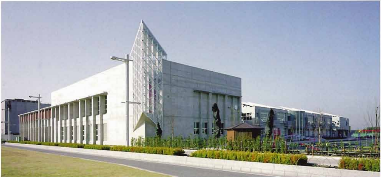
街のアイストップとなるガラスの三角柱

幕張新都心は未来型の複合機能都市といわれる。幕張メッセや高層のホテル・オフィスビルが林立するが、ここは1万人余が暮らす街(幕張ベイタウン)でもある。海浜打瀬小学校は、この地域の生徒増に対応するため打瀬小学校の兄弟校として建設され、平成13年春に開校した。両校とも地域に開かれ、子どもたちや住民にとって魅力的な生活学習空間として高い評価を得ている。