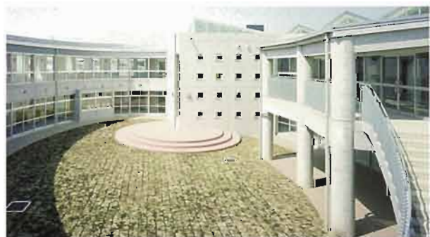
さまざまなシーンがあふれる中庭

る学校」を目指して行政・地域・学校・設計者が一丸となって取り組んだ成果といえよう。