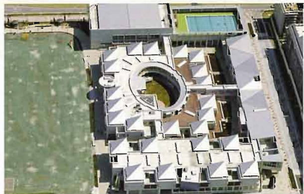
上空から望む第5のファサード