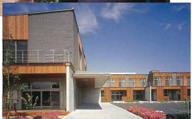
正面玄関アプローチ

何か特別なことをしようという発想ではなく、障害があってもごく普通の存在として、ごく普通に生活できる環境をととのえようという強い意志のもとに生まれた、まさにやさしい空間である。