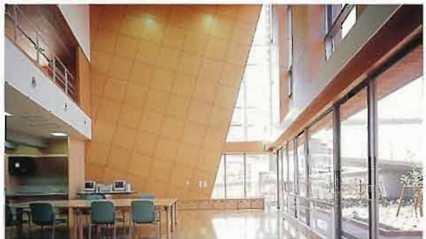
明るいデイルーム

ここを拠点に地域の人々が集い、また、ここから多くの人々が地域に帰っていくことがごく自然に期待できる空間が創造されたことを高く評価したい。こうした空間が、地域にごくあたり前に存在する時代が到来したとするならば、喜ばしいかぎりである。 (園田眞理子)