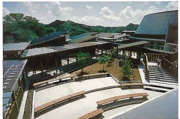
ふれあいコートの屋外劇場

この地域と密着した小学校のあり方はプログラムの点から多めに評価されるべきであるし、多様な構成の中に小