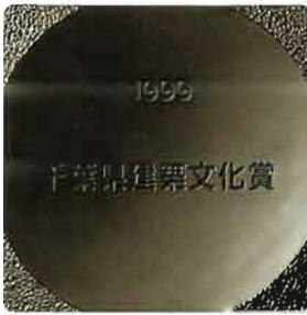
デザイン：株式会社GKデザイン機構 制作：鋳心ノ工房