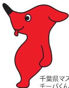
千葉県マスコットキャラクター チーバくん