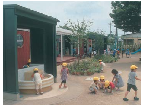
庇つきの長いデッキに面した園庭