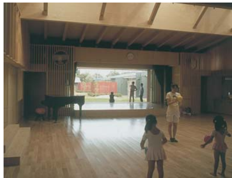
竹林、ふれあいの森（裏庭）が一望できるたけのこホール