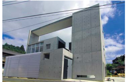
全景 南側ファサード