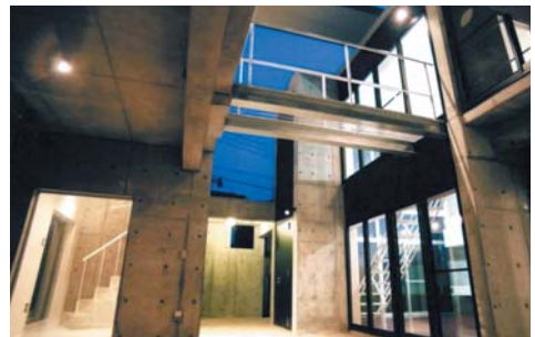
中庭夜景 ライトコート

建築主：社会福祉法人千葉ベタニヤホーム 設計：株式会社藤木隆男建築研究所 施工：清水建設株式会社千葉支店 所在地：千葉市若葉区