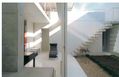
ベリメーターゾーンの吹抜と外部との関係