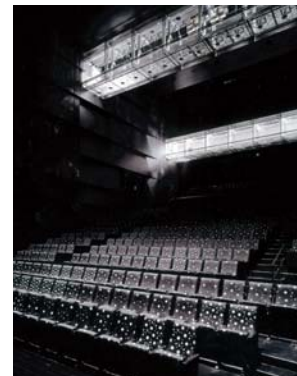
中ホール 空中にライトチューブが浮かぶ