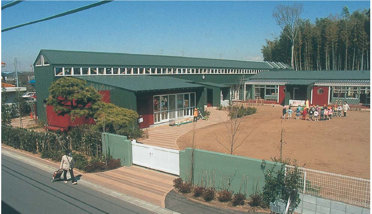
周囲をとりまく竹林や植栽の緑に馴染むように緑色を基調とした園舎外観

公共施設は地域のチャームポイントであってほしいと願うが、この幼稚園は耐震補強をかねた増改築の機会を見事に活用して、その期待に応える成果として高い評価を受けた。