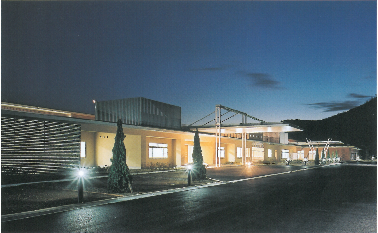
エントランス面夜景

この施設は、養老溪谷に位置していた老朽化した既存の施設の建替え事業として、緑重なる山間部の新しく切り拓かれた土地に誕生した高齢者施設である。