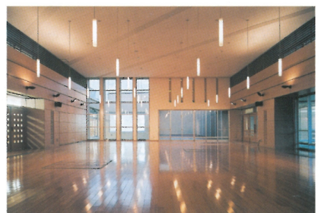
施設のある中心にある食堂（軽費老人ホーム）