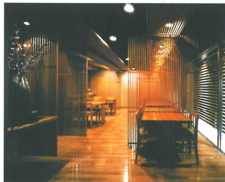
店舗内観