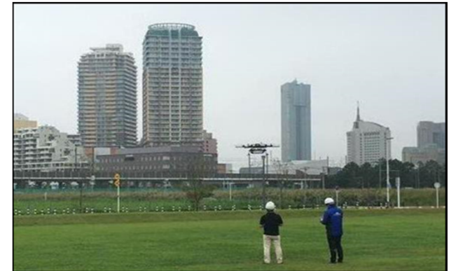
※国家戦略特区制度を活用したドローン宅配等実証実験の様子