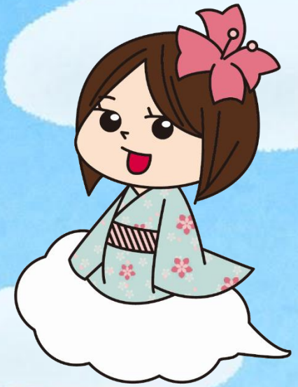
君津地域PRキャラクター きてねちゃん