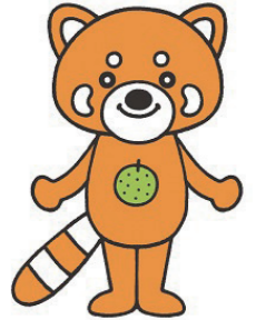
市川市動植物園 マスコットキャラクター 市川梨丸