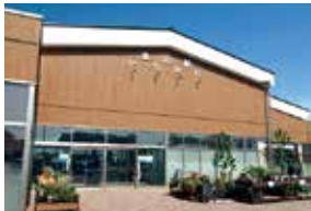
【最寄駅】JR総武線市川駅 (バス約10分)

国道298号沿いに位置する県内29番目の道の駅です。市川や千葉県の特産品に、地元で採れた野菜を使用した本格イタリアン、目の前で焙煎される世界各国のコーヒー豆など、他の道の駅とは違った楽しみ方が味わえます。