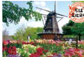
【最寄駅】新京成線三咲駅(バス約15分)。 新京成バス「アンデルセン公園」または「アンデルセン公園西口」下車

アスレチックなどで自由に遊べる「ワンパク王国」、19世紀のデンマークの牧歌的な風景を再現した「メルヘンの丘」、創作体験を楽しめる「子ども美術館」など、5つのゾーンからなる総合公園です。