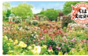
【最寄駅】東葉高速線八千代緑が丘駅(徒歩約15分)。東洋バス「京成バラ園」下車

今年は、1,600品種1万株のバラが咲く春のガーデンにアート作品と7つのミニガーデンが初登場。他にも、新作のバラ「ローズ スーボ」の5品種など。春の花々が咲く開放感あふれるローズガーデンで癒しのひとときが過ごせます。