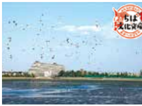
【最寄駅】京成線谷津駅(徒歩約10分)

一周約3.5kmの観察路では、鳥の様子や夕景を見ながらウォーキングができる他、自然観察センターでは谷津干潟の自然に詳しいレンジャーが、野鳥や生きもの見どころを案内します。