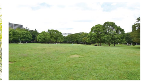
千葉県立行田公園

個別のまち歩きへの参加方法やコースに関する事は各鉄道会社の問い合わせ先にてご確認ください。