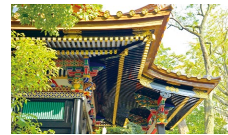
船橋大神宮(意富比神社)