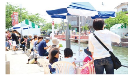
カフェテラス in 境川