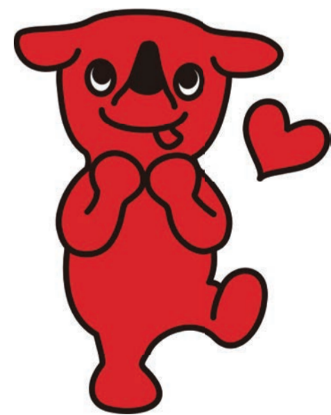
千葉県 マスコットキャラクター チーバくん