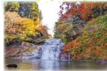
大多喜町紹介動画