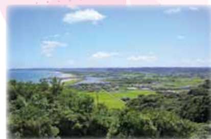
いすみ市紹介動画