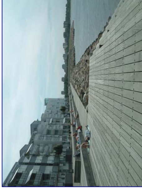
テッキ天端のイメージ