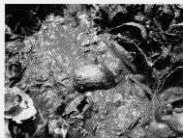
カキ礁を棲み場とする生物 ウネナシトマヤガイ