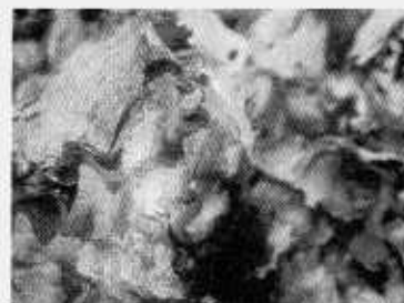
カキ礁を棲み場とする生物 タマキビガイ この他にアラムシロガイ、ヤドカリ類 イソガニなどが多数生息する。