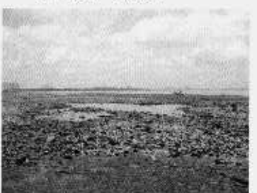
カキ礁の沖側。アオサ繁茂域が広がる。