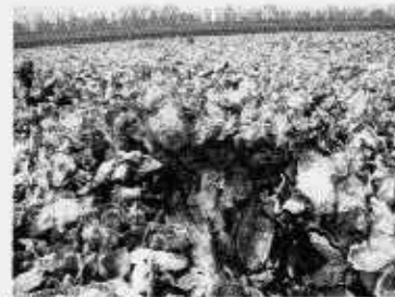
カキ礁を形成するマガキ 層状に積み重なっている。(450m付近)