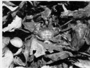
カキ礁を棲み場とする生物 ケフサイシガニ