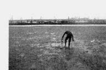
250m地点より測線起点方向(岸側)を望む。春季では干出域はアオサ(緑藻類)が被度100%で繁茂する。夏季はアオサの被度は半減していた。