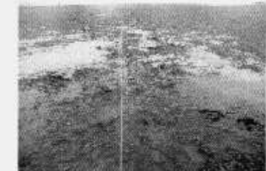
250m地点より測線終点方向(沖側)を望む。春季では干出域はアオサ(緑藻類)が被度100%で繁茂する。夏季はアオサの被度は半減していた。