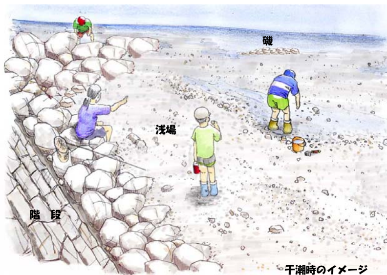
干潮時のイメージ