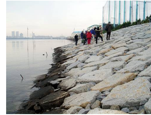
実際現地で、暫定的に工事した状況です