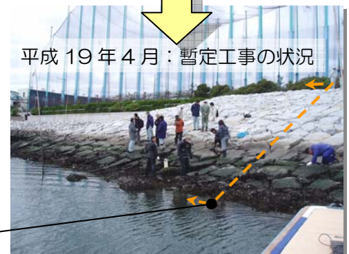
平成19年4月：暫定工事の状況