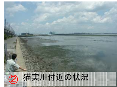
② 猫実川付近の状況