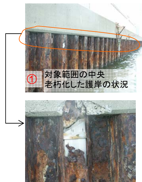
① 対象範囲の中央 老朽化した護岸の状況