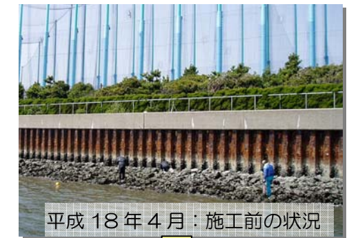
平成18年4月：施工前の状況

一方、本事業では生物や海底の地形を調査して、必要に応じて、工事の手順や構造のより良い工夫を行いながら、“防護”、“環境”、“利用”の調和のとれた海辺の創造を目指しています。