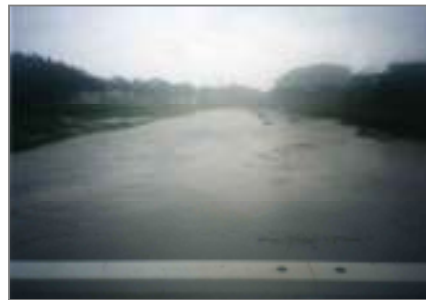
平成13年9月11日 台風15号による溢水

平成20年度から、時間雨量52mm(降雨確率規模1/10)に対応する工事に着手。