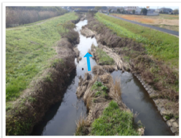
辺田前橋下流の状況