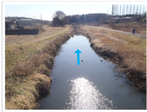
小倉大橋下流の状況