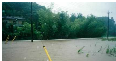
【平成12年】岡田橋付近浸水状況