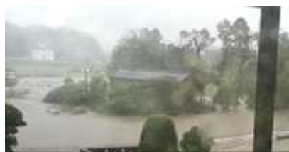
【平成25年】岡田橋付近浸水状況