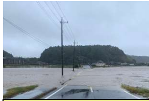
【令和元年】山武市矢部付近浸水状況