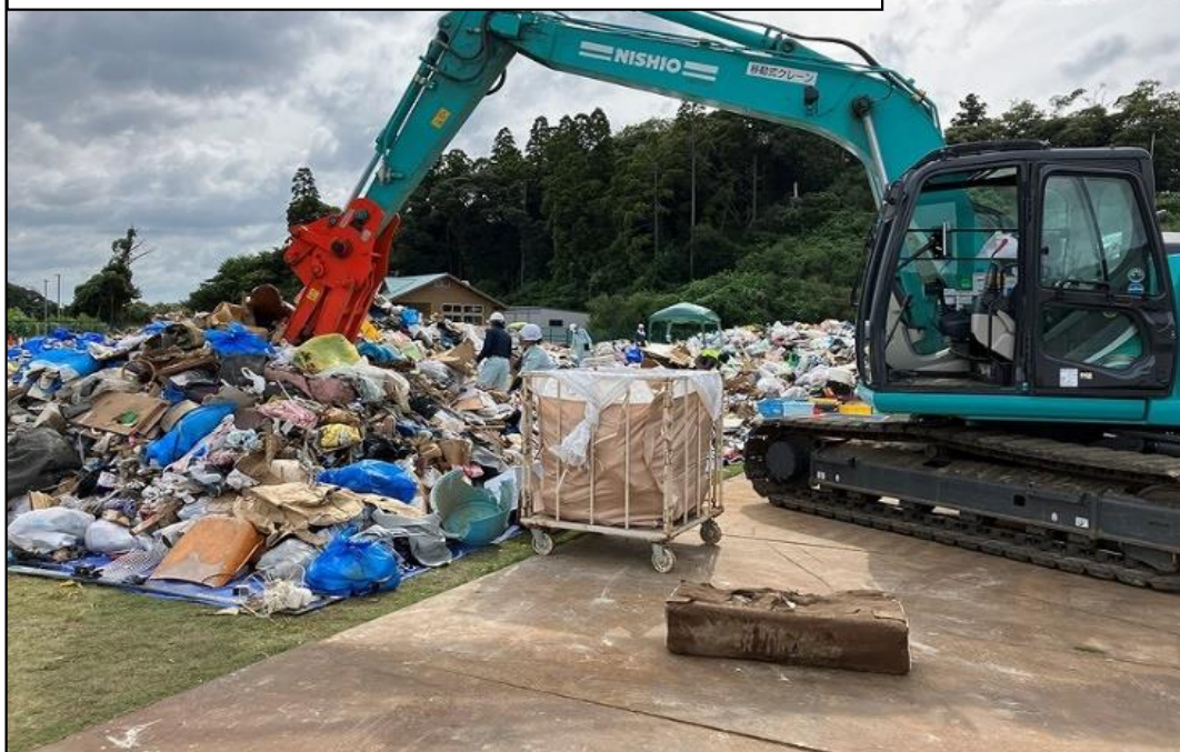
茂原市 災害廃棄物仮置き場の状況

↳被災市町村に対して応援職員を派遣 ・災害廃棄物仮置き場の運營業務 ・住家の被害調査 等