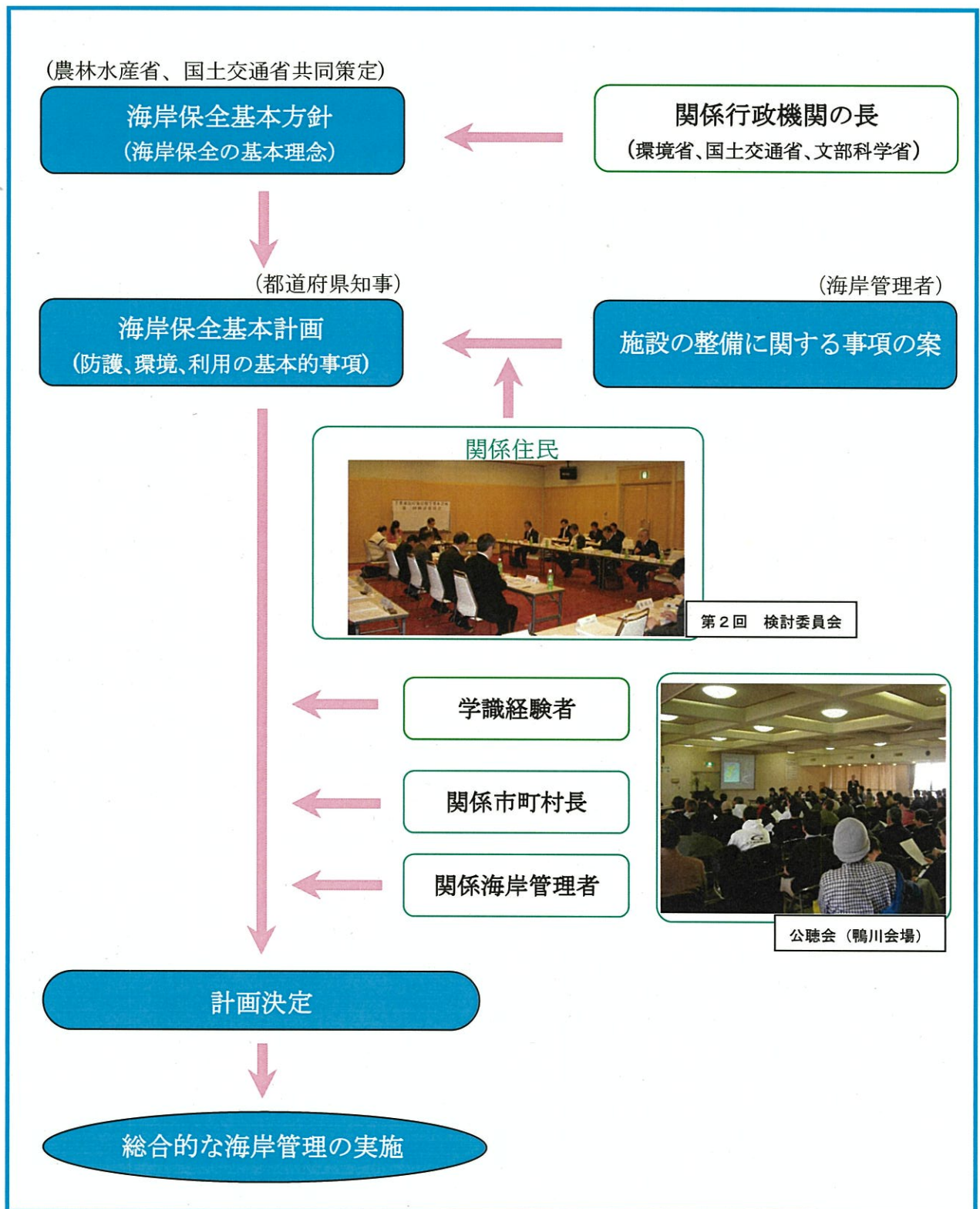
図-3 海岸保全の計画制度