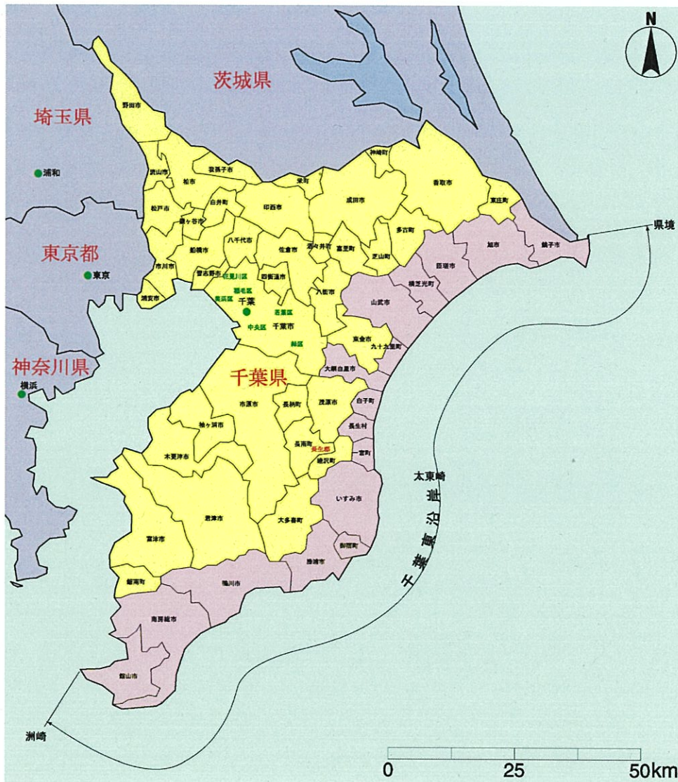
図-1 千葉東沿岸の位置図

このような状況に鑑み、千葉県は、茨城県境から洲崎に至る延長約230kmの千葉東沿岸を広域的な視点でとらえ、「千葉東沿岸海岸保全基本計画」を策定し、各海岸の特性に応じた海岸防護のための海岸保全施設の整備等をはじめ、海岸環境の保全や海岸利用に配慮した総合的な海岸保全を推進していく。