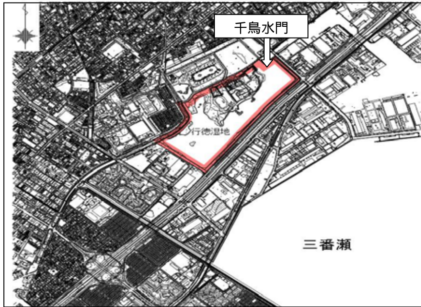
図 2 - 2 - 1 行徳湿地位置図