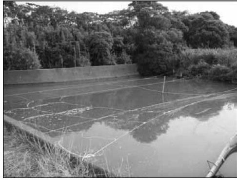
メッシュ設置状況